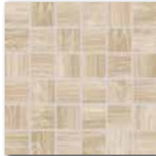
DDM06716 (SET) PEI 4 ○ 72 / set mat | matt