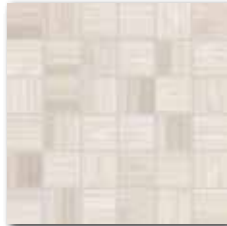
DDM06715 (SET) PEI 5 ○ 72 / set mat | matt