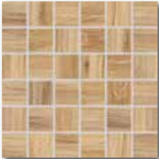
DDM06717 (SET) PEI 4 ○ 72 / set mat | matt