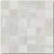
DDM06719 (SET) PEI 5 ○ 72 / set mat | matt